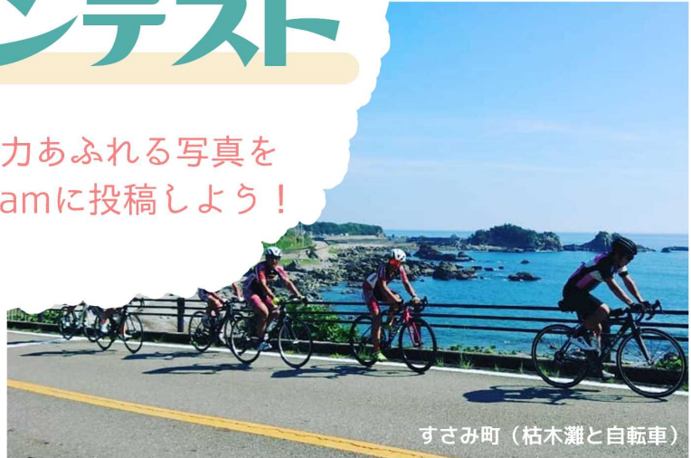
すさみ町（枯木灘と自転車）

※南紀エリアとは和歌山県の4市町（田辺市、白浜町、上富田町、すさみ町）のことを指しています。