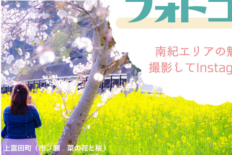
上富田町（市ノ瀬 菜の花と桜）